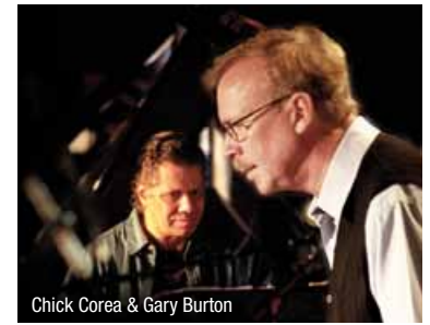
Chick Corea & Gary Burton

Donnerstag 22. Mär '12 19.30 Uhr Jazz 18.00 Uhr